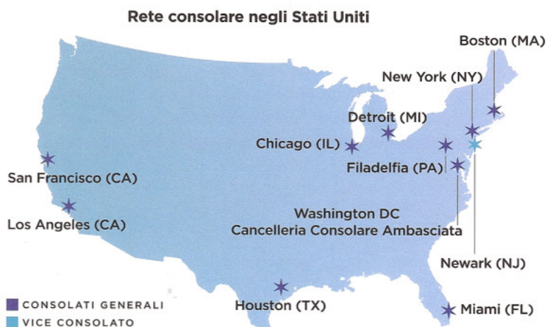
L'attività dei Consolati italiani negli Stati Uniti - 2007